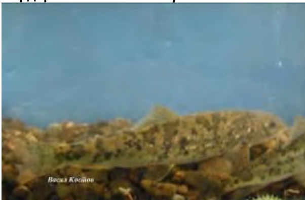
Црна мрена - Barbus balcanicus