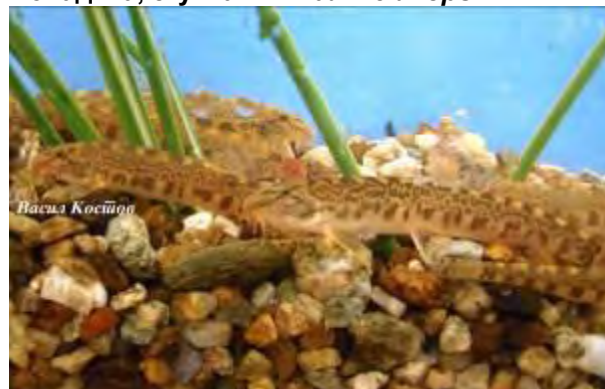
Златна штипалка - Sabanejewia balcanica