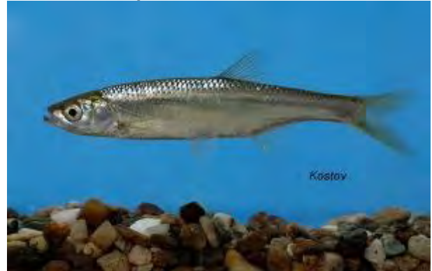
Плашица – Alburnus sp.