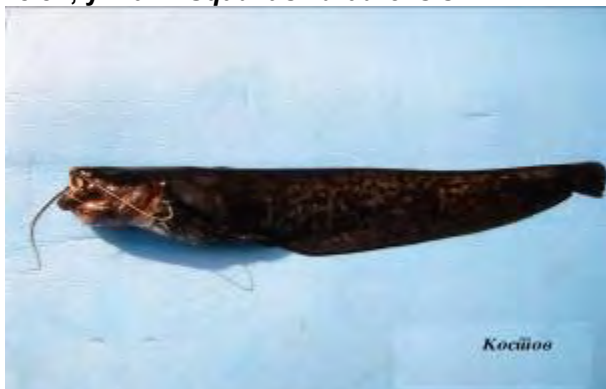
Сом - Silurus glanis