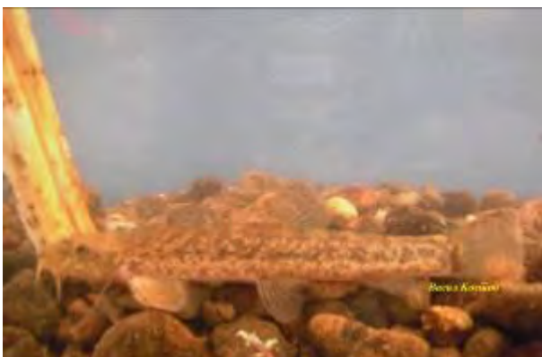
Вретенушка - Barbatula barbatula