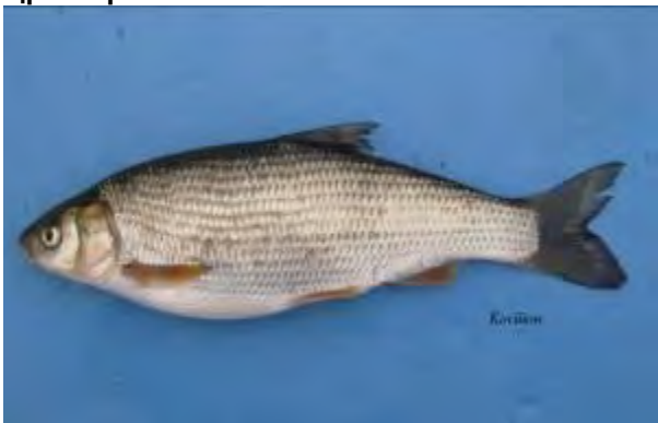
Скобуст, бојник - Chondrostoma vardarense