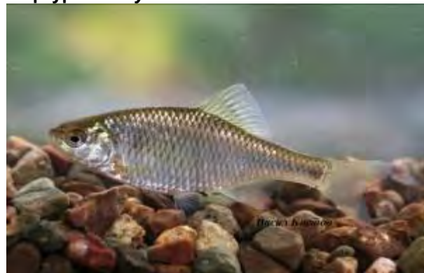
Платиче - Rhodeus meridionalis