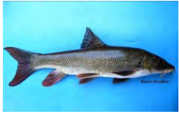
Македонска мрена - Barbus macedonicus