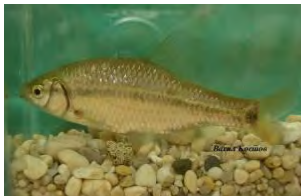
Мергур - Pachychilon macedonicum