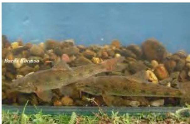
Кркушка - Gobio bulgaricus