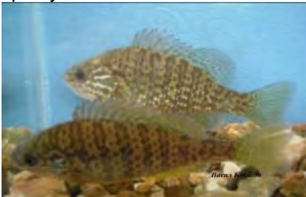
Сончаница - Lepomis gibbosus

Во текстот се дадени основните биолошки карактеристики на значајните, од аспект на рекреативен риболов, видови риби кои ги населуваат водите за кои се однесува риболовната основа.