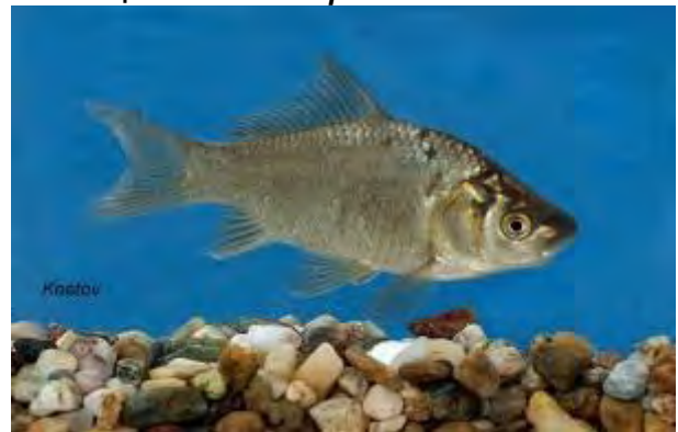
Сребрен карас – Carassius gibelio