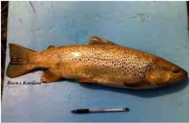
Македонска пастрмка - Salmo macedonicus