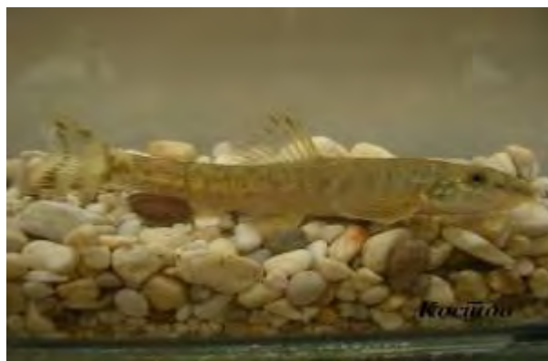
Вретенушка - Oxynoemacheilus bureschi