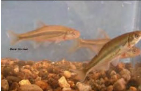
Вардарка - Alburnoides bipunctatus