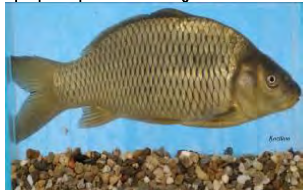
Крап - Cyprinus carpio