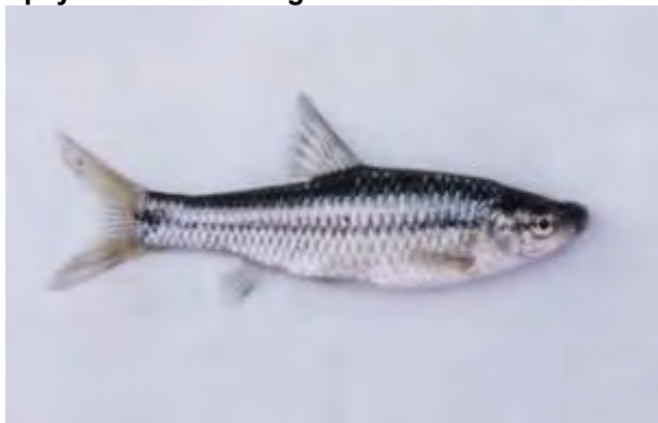
Амурче - Pseudorasbora parva